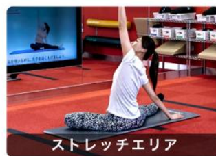
ストレッチエリア